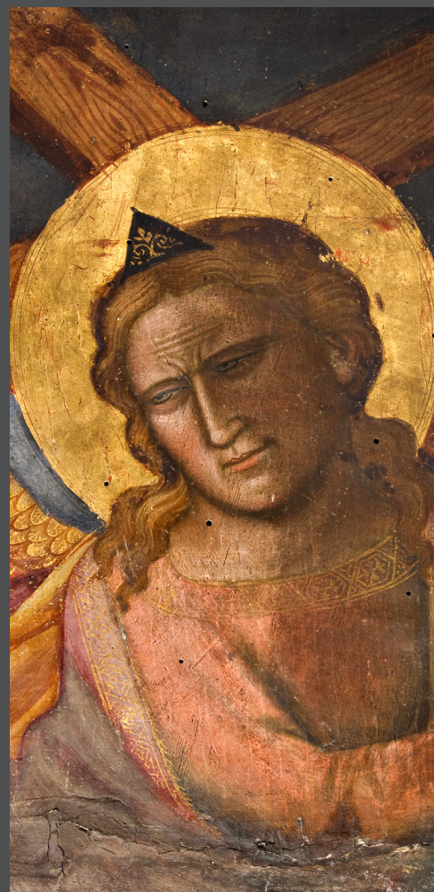
Niccolò di Pietro Gerini, Nanebevstoupení Krista - detail, snímání ztmavlé lakové vrstvy