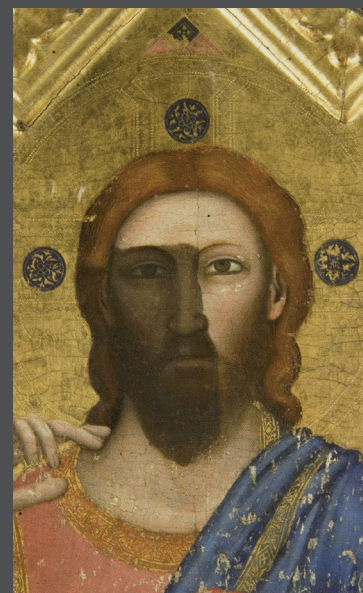
Ukřižovaný Kristus, Giotto kostel Ognissanti ve Florencii - detail, snímání ztmavlé lakové vrstvy

Seminář organizuje Metodické centrum Národní galerie v Praze