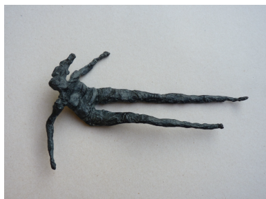
Malá plavkyně – dlouhé nohy (1966)