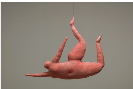
Plavkyně I (1969 – 1974)

Inspirujme se díly Kurta Gebauera, jehož výstavu jsme zahájili na začátku března. Zdrojem námětů děl tohoto umělce jsou často obyčejní lidé a jejich přirozený pohyb. Plavce a plavkyně pozoruje už několik desítek let – jejich nenucené pohyby jakoby ve stavu beztlíže, optické proměny lidského těla pod vodní hladinou. A právě těmi se budeme dnes inspirovat.