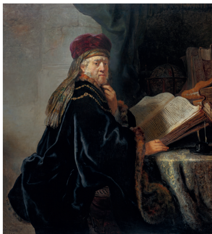
Rembrandt Harmensz. van Rijn

Napište fantastickou povídku nebo nakreslete komiks o muži z Rembrandtova obrazu. Možná o něm něco prozradí věci, které ho obklopují: glóbus, kniha, prsten na ruce, hebký plášť s kožešinou, zlatý řetěz kolem krku, pokrývka hlavy, kalamář. Proč tu jsou? Do textu můžete zapojit jen některé detaily, jako je prsten, gesto ruky atd.