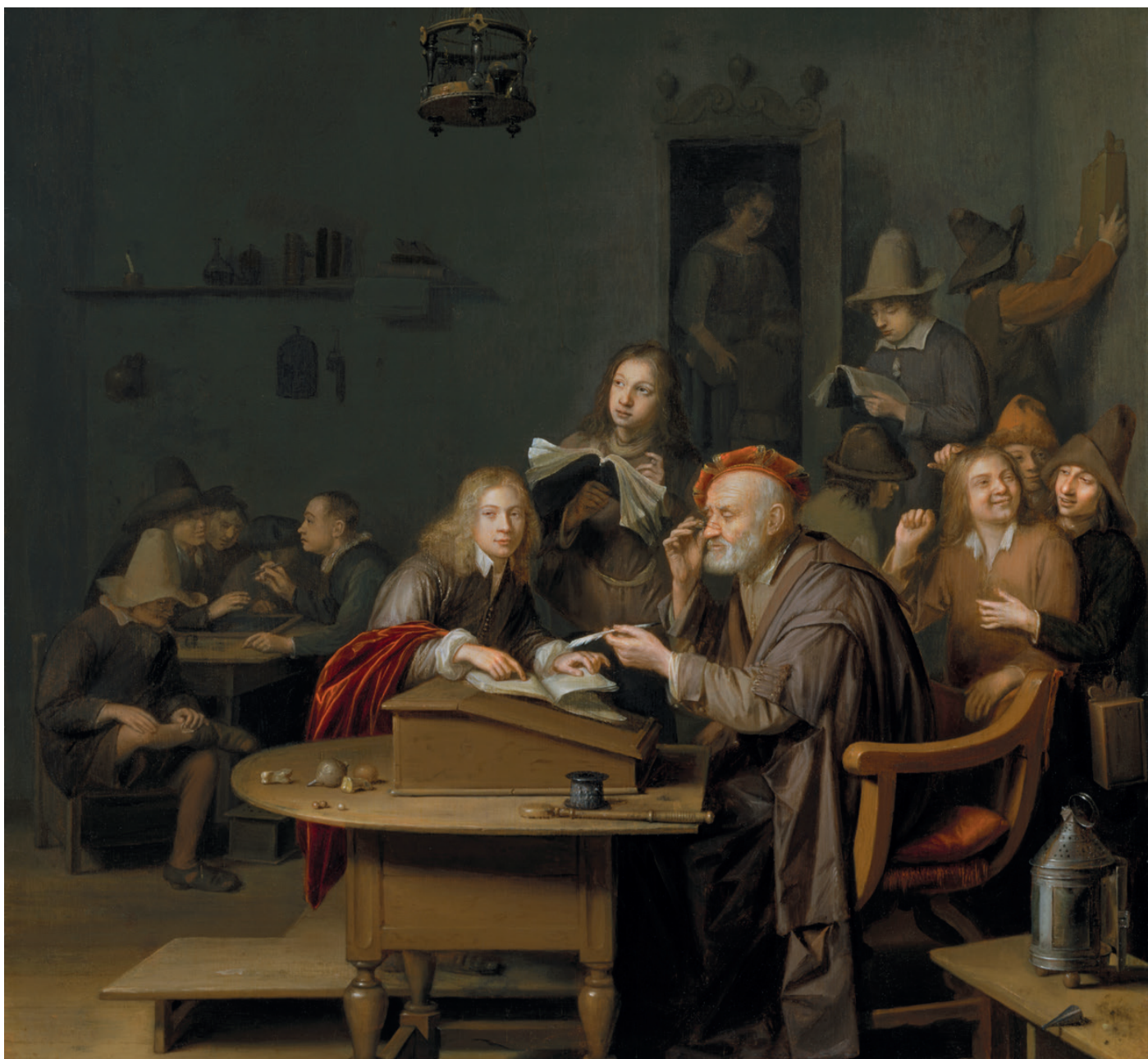
Pieter Hermansz. Verelst Učitel mezi žáky , kolem 1650 The Kremer Collection