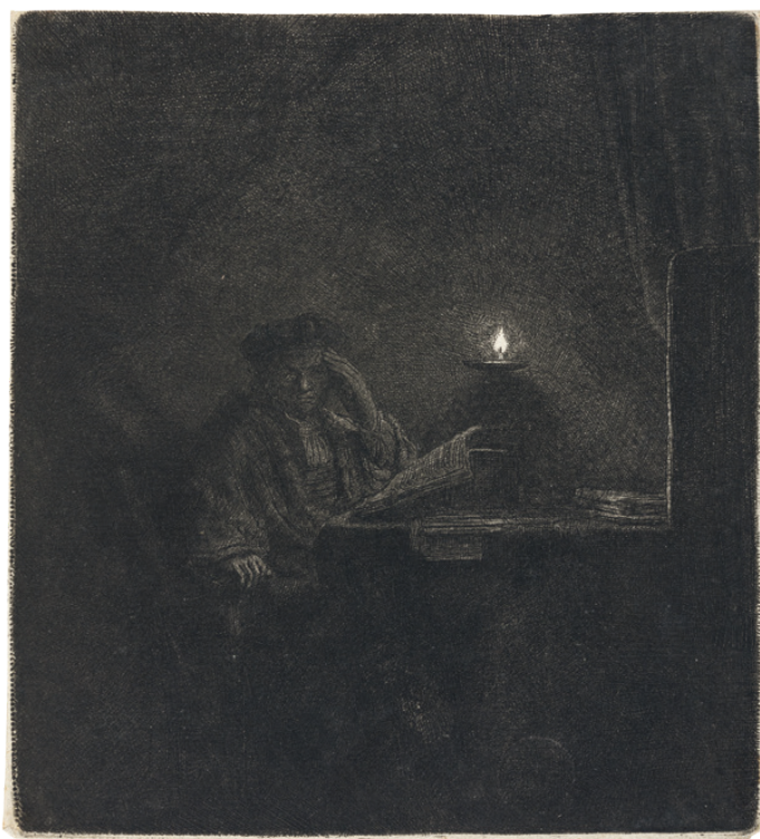
Rembrandt Harmensz. van Rijn Student u stolu ve světle svíčky , kolem 1642 lept, papír Národní galerie Praha

Připravte si bílou čtvrtku a celou ji pečlivě pokryjte přírodním uhlím. Vezměte si plastickou gumu. Použijte ji jako malířský nástroj – odebírejte černý uhlí až do světlého podkladu.