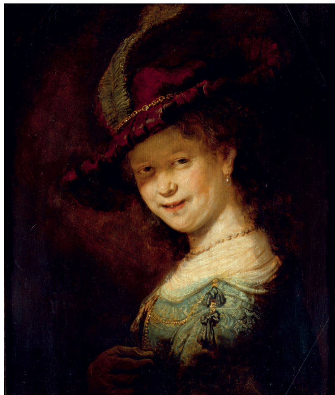
Rembrandt Harmensz. van Rijn Saskia van Uylenburgh jako dívka , 1633 Staatliche Kunstsammlungen Dresden, Gemäldegalerie Alte Meister

Narodil se v rodině leidenského mlynáře 15. 7. 1606 jako deváté dítě a také jediné, kterému rodiče dopřáli studium na latinské škole. Asi ve 14 letech vstoupil do učení k Jacobovi van Swanenburgh. Své školení završil půlročním pobytem v dílně amsterdamského malíře Pietera Lastmana, který mladého malíře seznámil s italským uměním. Rembrandt nikdy necestoval do evropských center a po celý život zůstával v Holandsku.