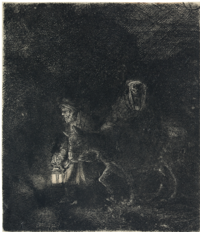
Rembrandt Harmensz. van Rijn Útěk do Egypta – noční scéna , 1651 lept, suchá jehla, papír Národní galerie Praha https://sbirky.ngprague.cz/dielo/CZE:NG.R_143710

Staňte se uměleckými kritiky. Vyberte jedno dílo z výstavy a prostudujte ho pomocí těchto otázek. Jde o vaši analýzu, názor, interpretaci a popis. Můžete pracovat ve dvojicích či skupinách.