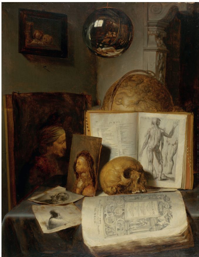
Simon Luttichuys Zátiší s lebkou – Vanitas , kolem 1645 Gdaňsk, Muzeum Narodowe w Gdańsku