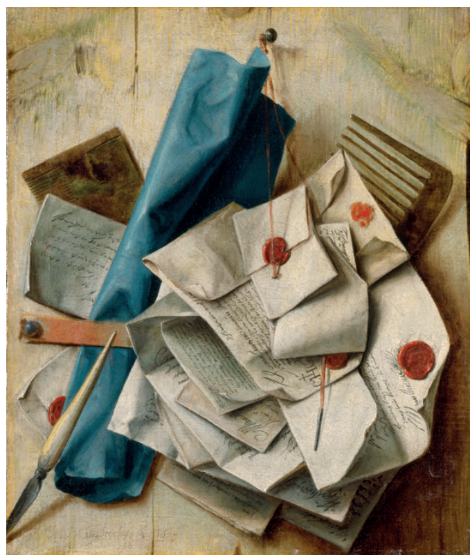
Cornelis Norbertus Gijsbrechts Quodlibet s dopisy, hřebeny a svitkem modrého papíru , 1675 Kolín nad Rýnem, Wallraf-Richartz-Museum & Fondation Corboud