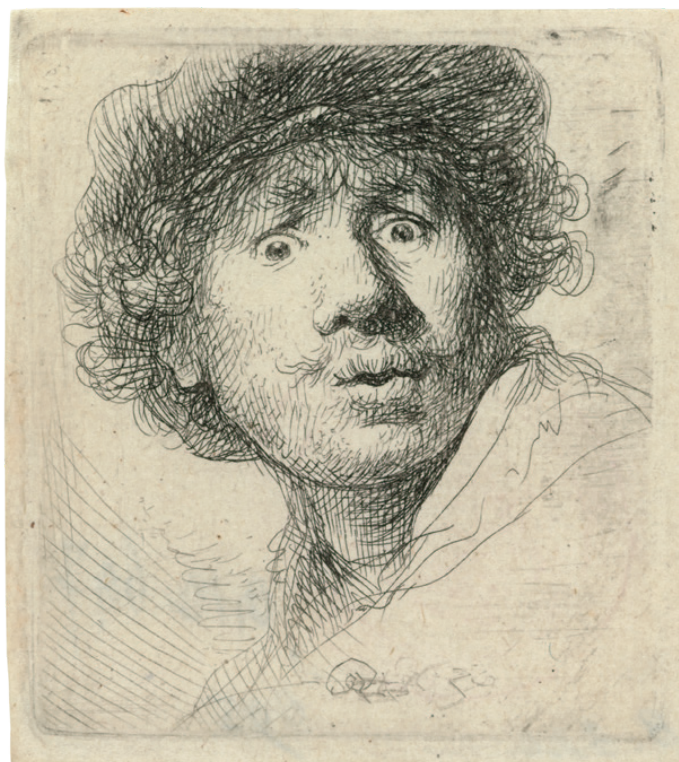
Rembrandt Harmensz. van Rijn Autoportrét v baretu s udiveným výrazem , 1630 lept, papír Rijksmuseum Amsterdam