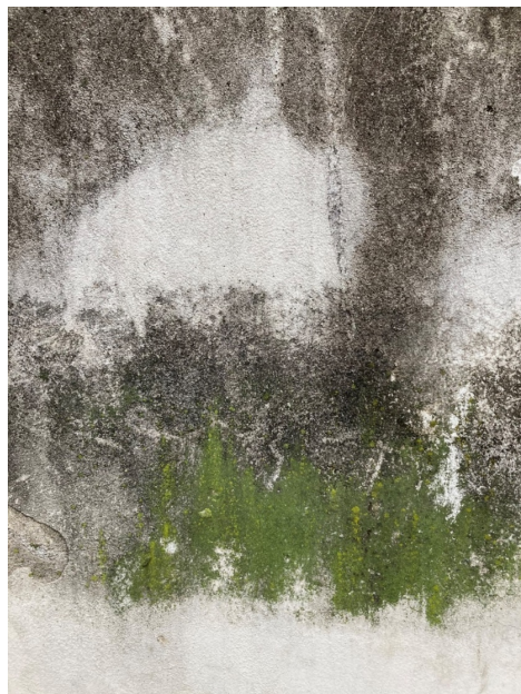
Mech i plíseň na stěnách zanechává zajímavé grafické stopy