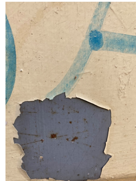
Opadané barvy a omítky odkrývají barevné plochy spodních vrstev