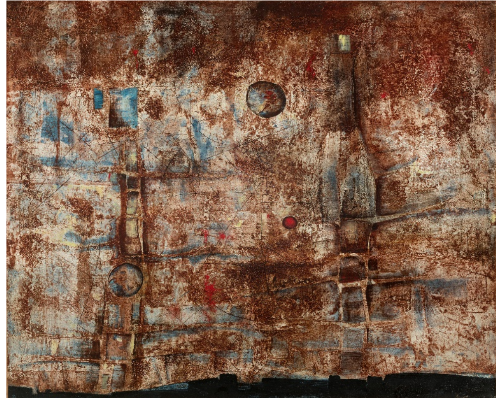
Mikuláš Medek, Dvě kostrče, 1960, Národní galerie Praha