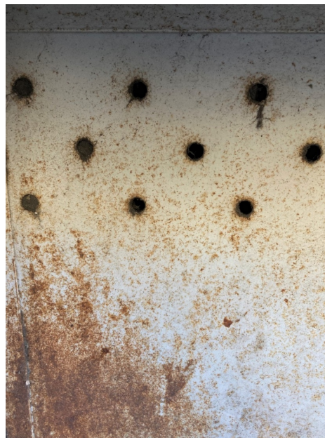
Různé otvory a rez vytváří obrazy, které mají různé hloubky