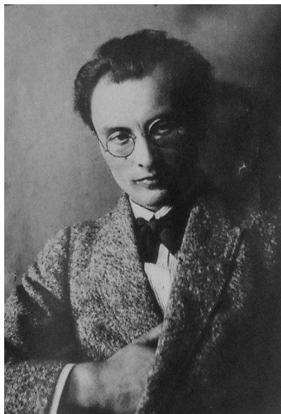
Zdeněk Pešánek, autoportrét, 1920, soukromá sbírka