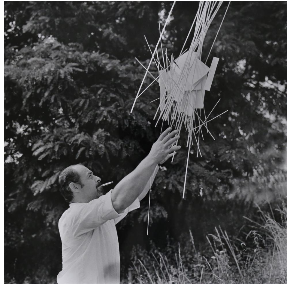
Hugo Demartini: Demonstrace v prostoru, 1968, Národní galerie Praha

„Snaha byla, vyfotit to v momentu, kdy se to zdánlivě zastaví a začne padat.“ Hugo Demartini