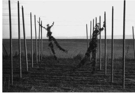
Kurt Gebauer, Figury, 1983, Mutějovice, figury z chmelové natě, původní fotografická dokumentace sympozium Mutějovice