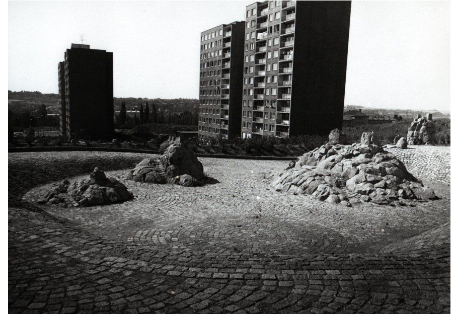
Kurt Gebauer, Obludy, Praha – sídliště Dědina, 1981, původní fotografická dokumentace