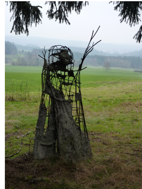
Kurt Gebauer, Přírodní zločinec, 2006, původní fotografická dokumentace

Zdá se vám někdy, že pařez, strom, hrouda písku nebo kupa sena vypadají jako živé? Skoro se leknete, jestli to není nějaký zvláštní tvor? Dnešní výzvou bude nalézat obludy v prostředí krajiny či města a zkusit si svou vlastní jednoduše vytvarovat. Krok budeme držet s významným českým sochařem Kurtem Gebauerem, který pro nás venku různé obludy vytvářel. Skupinku rozteklých, z kamenných kvádrů složených hlav můžete navštívit i na dětském hřišti na pražském sídlišti Dědina.