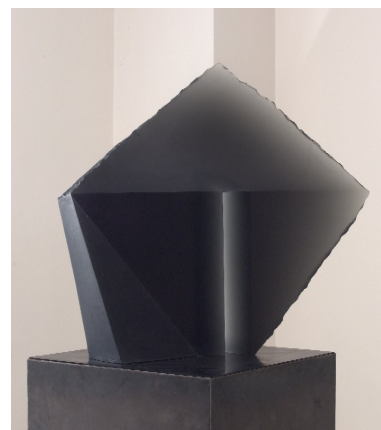
Stanislav Libenský – Jaroslava Brychtová, Prostor II, 1992, NGP