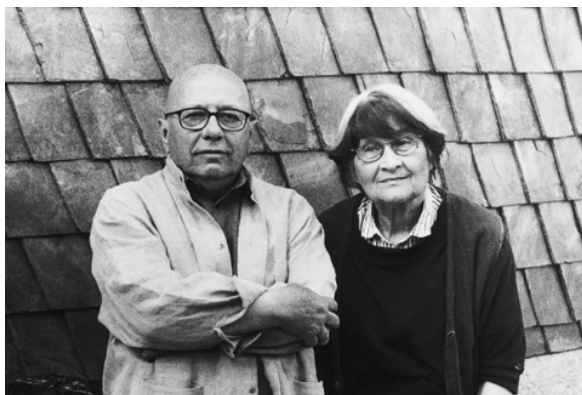
Stanislav Libenský a Jaroslava Brychtová