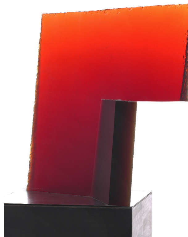
Stanislav Libenský – Jaroslava Brychtová, Otevřené okno – červené, 1995, NGP

Také vaši pozornost přitahují rampouchy nebo zamrzlé louže? Potají si každý led osaháte a nejrady byste si vzali i kus s sebou domů? Zkuste si vytvořit svůj vlastní ledový objekt. Využijte k tomu mrazivé počasí venku či mrazák doma. Inspirujte se tvorbou umělců Stanislava Libenského a Jaroslavy Brychtové, kteří jako jedni z prvních vytvářeli velkoformátové skleněné objekty. Jejich technika taveného skla jim umožnila vyrábět nevídané skleněné realizace, které ovlivnily mnoho současných sklářů. Jejich plastiky je možné vidět i v architektuře na Ještědu nebo na nové scéně Národního divadla.