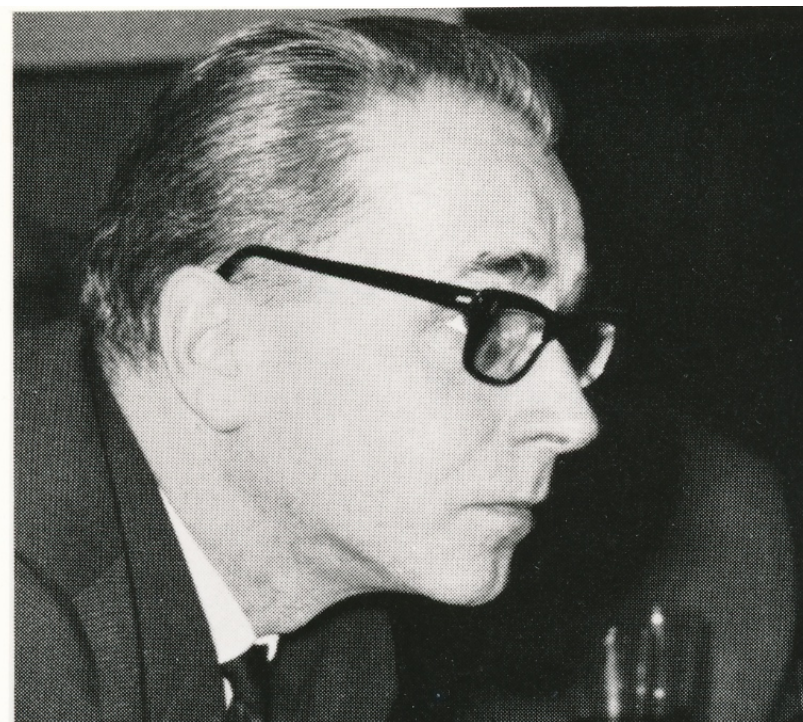
Jiří Kolář