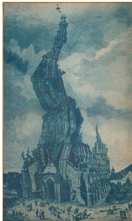
Jiří Kolář využíval zmačkaného motivu i ve svých kolážích. Snící katedrála, 1964–1968, NGP