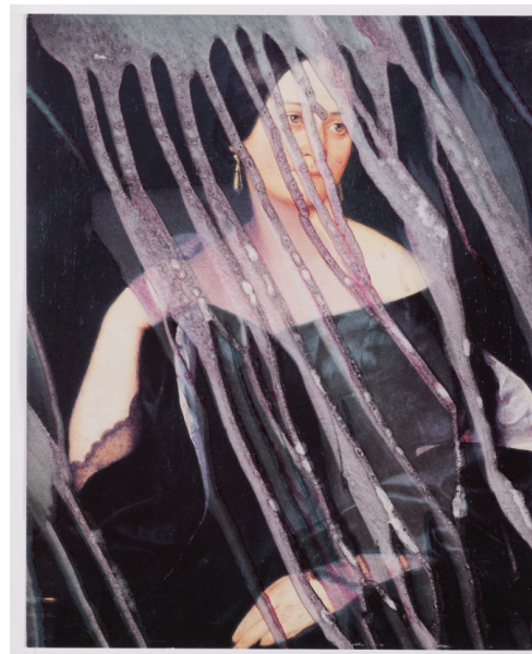
Jiří Kolář s proměnou portrétů pracoval velmi často. Z cyklu Božena Němcová, 1995, NGP

V první výzvě se inspirováme netradiční technikou koláže umělce a básníka Jiřího Koláře. „Každý spisovatel zná, co to je napsat tři čtyři verze textu a všechny hodit zmačkané do koše. Jednou se mi stalo totéž. Když jsem dal nový papír do stroje, napadlo mě, jestli první verze toho, co chci napsat – ta pohozená verze –, byla opravdu k zahození. Když jsem ji vybral z koše a trochu urovnal, blesklo mi hlavou, co textu chybělo – totiž ono umačkání...“ Jiří Kolář ono umačkání pojmenoval muchláž a ve své tvorbě se k ní poměrně často a rád vracel. Také vás někdy zaujal zmuchlaný papír s textem či obrázkem?