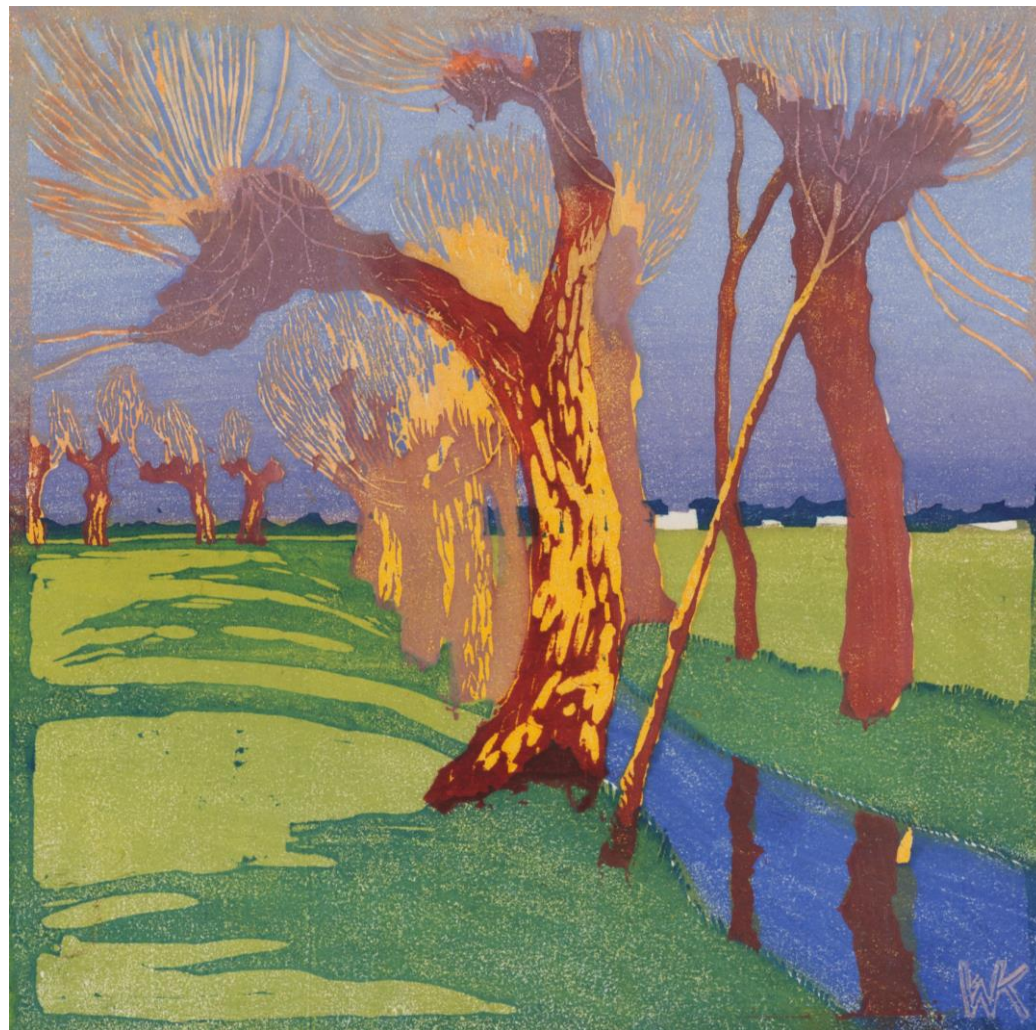
Walther Klemm, Jaro na vesnici, NGP, 1907