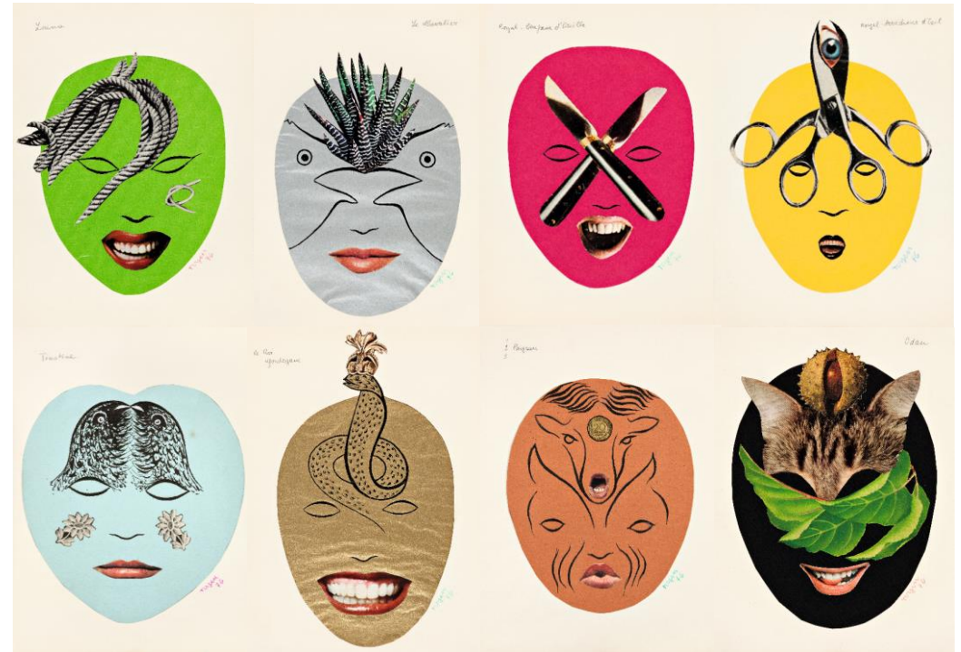
Toyen, Masky pro divadelní provedení hry Radovana Ivšiče Le Roi Gordogane [Král Gordogane], soukromá sbírka, Paříž, 1976

Maskami si zakrýváme obličej, abychom chránili sebe nebo druhé. Jiné masky nasazujeme v běžném životě proto, abychom nepoutali příliš pozornosti a dobře zapadli. Jde o druhy masek, které si většinou sami nevybíráme, ale do kterých nás tlačí okolí, abychom naplňovali očekávání vůči vzhledu, genderu nebo volbě budoucí profese. Některé masky využíváme, abychom zakryli emoce, a vytváříme si i různé druhy neutrálních poloh. Jindy masky nasazujeme proto, abychom se stali někým nebo něčím jiným: zvířaty, neexistujícími bytostmi se speciálními schopnostmi, konkrétními osobnostmi nebo charaktery. Skrze masky také můžeme vyjadřovat naše postoje včetně nesouhlasu s tím, co se okolo nás děje, například v rámci akcí: demonstrací nebo happeningů ve veřejném prostoru.