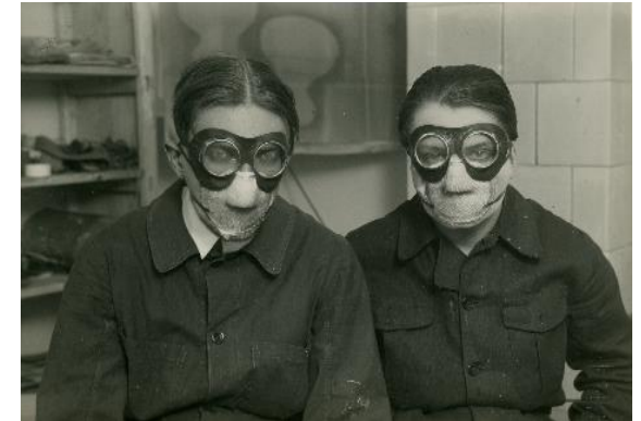
Jindřich Štyrský a Toyen při práci s toxickými barvami na hedvábí, 1929