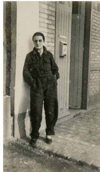
Toyen, Paříž, 1926