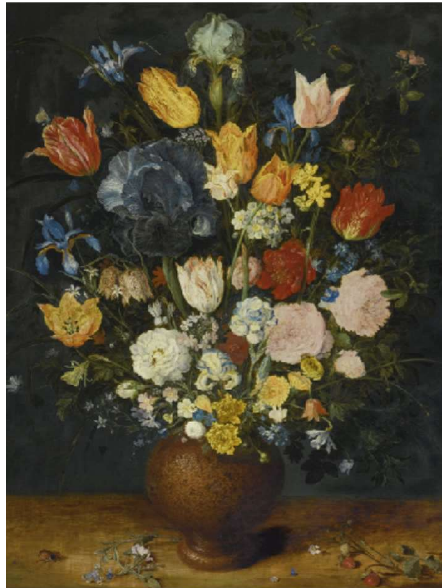
Jan Brueghel starší, Květinové zátiší(1607/1608)