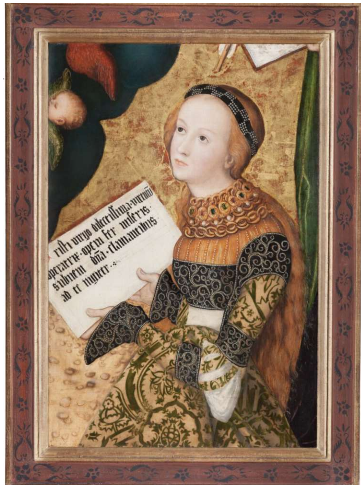
Lucas Cranach starší, Sv. Kristina (1520/1522) olej na dřevě, 74 x 55 cm