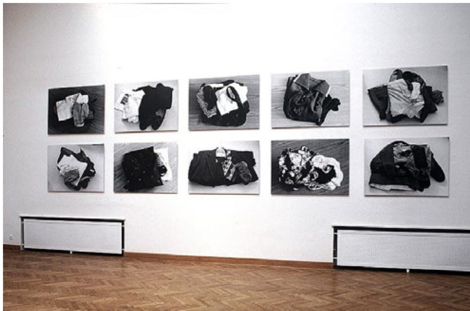
Milena Dopitová, S, M, L, XL, XXL , 1999, fotografie