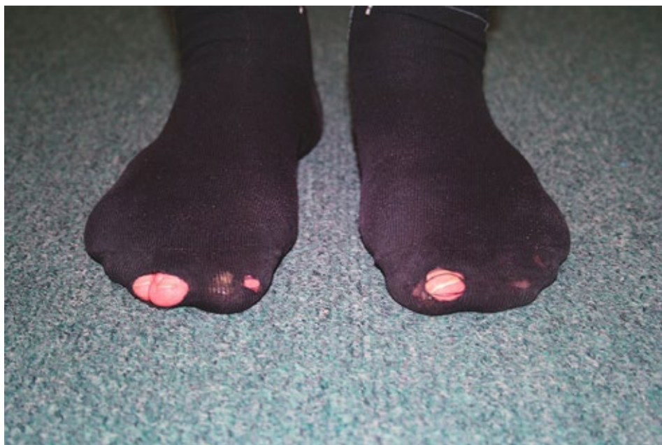
Milena Dopitová, Příště u vás , 2019, instalace