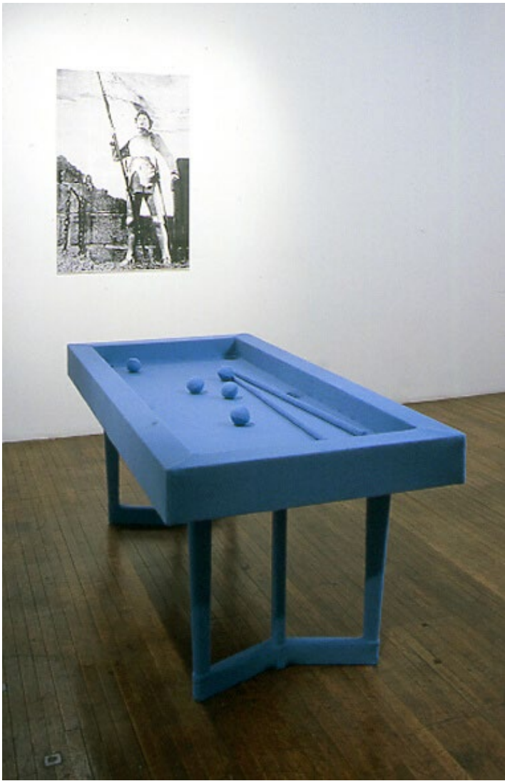
Milena Dopitová, Neboj se udělat ten velký krok , 1994, instalace