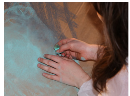
1. Chytání stínů - malba pastelem