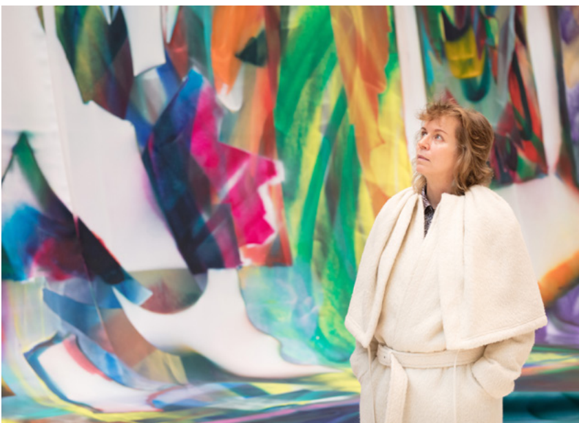
Katharina Grosse v instalaci ve Velké dvoraně Veletržního paláce.