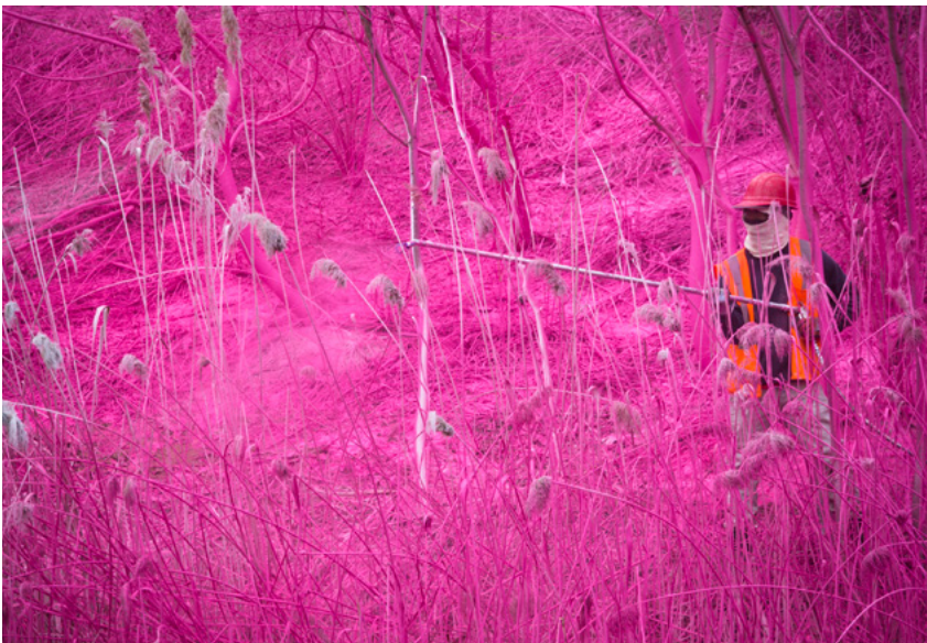
Katharina Grosse, Psychylustro - The Drama Wall, 2014, Philadelphia, Zadáno: City of Philadelphia Mural Arts Program, Se souhlasem König Galerie, Berlin Copyright: Katharina Grosse a VG Bild-Kunst, Bonn