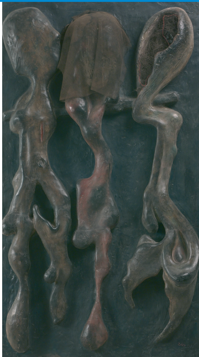
Tři ženy, 1937

V 50. letech v důsledku politických událostí a diktátu socialistického realismu Zívř uměleckou činnost na čas omezil. Na výstavě toto období reprezentuje několik podobizen zvířat. Sochař se tehdy v osamění obrátil za pomoci mikroskopu a dalekohledu ke studiu přírodních procesů a mikroskopických i makroskopických forem a k laboratorním výzkumům. Jeho pozdní dílo, vznikající po roce 1963 v ústraní v ateliéru ve Ždírci u Staré Paky, vychází především z tvarové inspirace tímto dlouholetým studiem přírody. Představuje ho přehledka různorodých biomorfních a vegetabilních forem ztvárněných v plastikách v 1. patře.