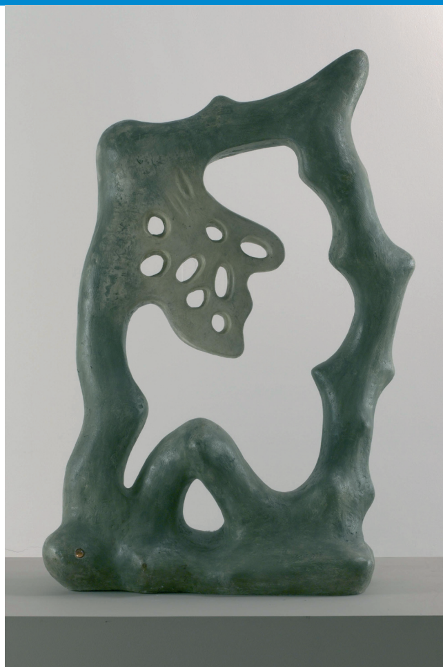
Koloběh života, 1973

Informace o otevírací době a vstupném / tel.: 224 372 327 (pokladna)