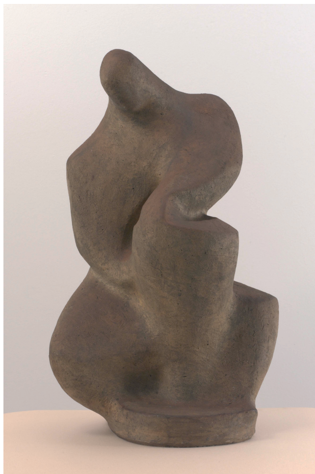
Hrnčíř, kolem 1947

Muláž / Experimentální technika, která spočívá v kombinování nalezených předmětů a přírodnin, jejich spojování sádrou a následném připevnění na desku.