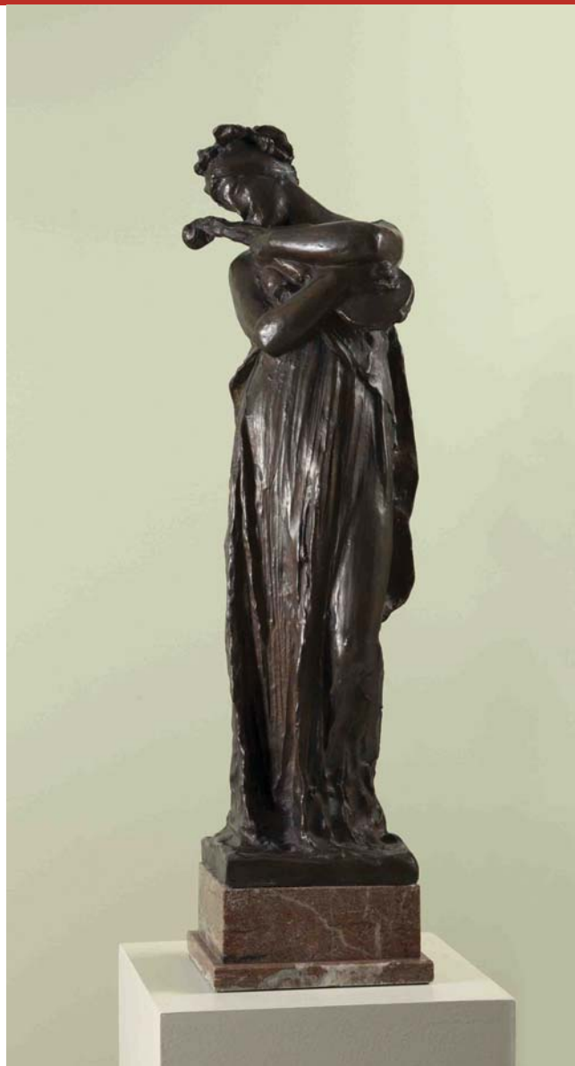
Josef Václav Myslbek: Hudba IV. náčrt, 1985, bronz Národní galerie v Praze