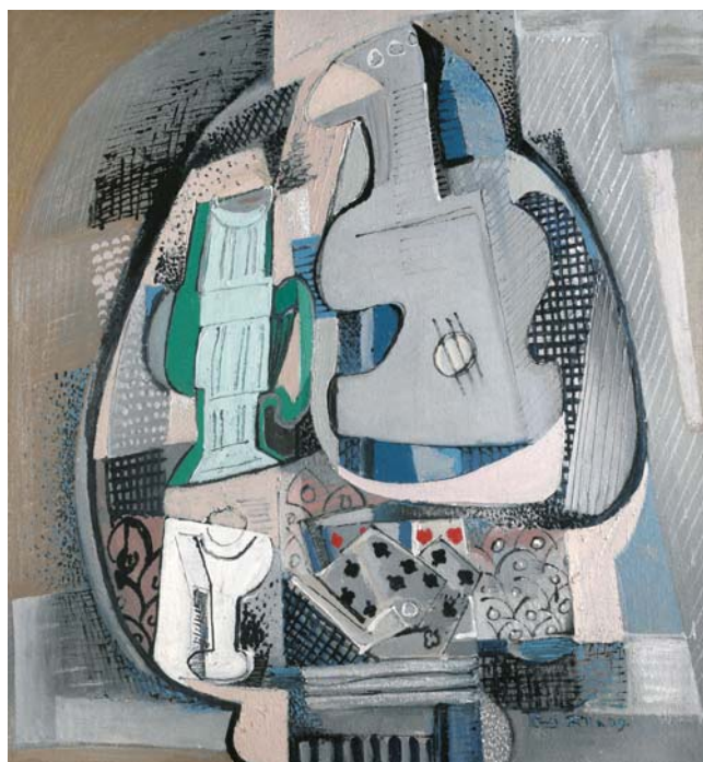
Emil Filla, Zátiší s kytarou a kartami, 1929 Národní galerie v Praze

Performance umělce Milana Grygara Prostorová partitura, říjen 2014 – přesný termín bude oznámen na Facebooku a www.ngprague.cz