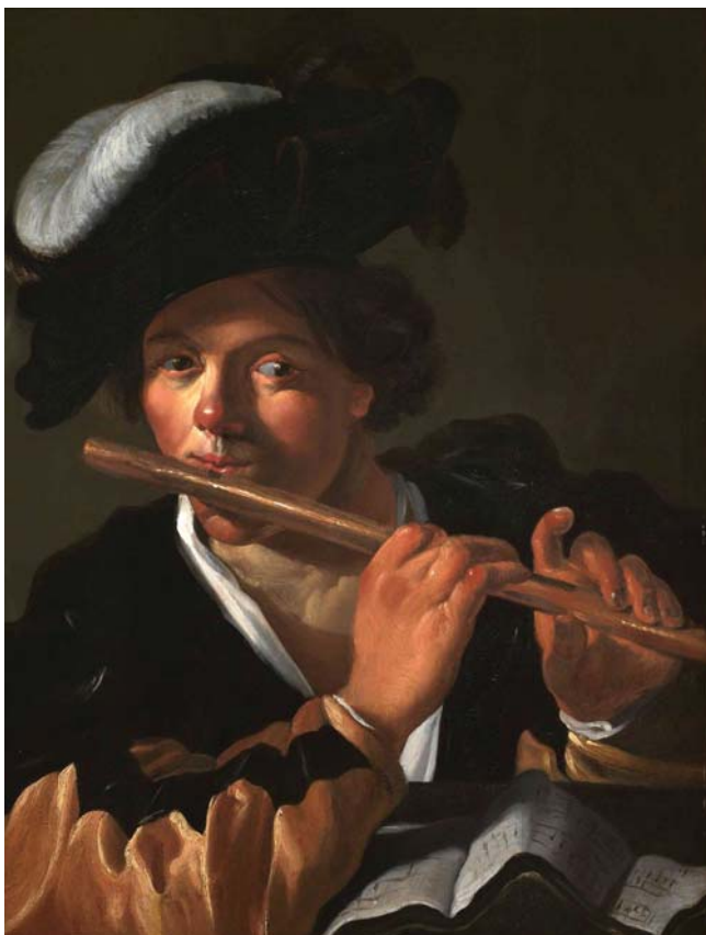
Dirck van Baburen – kopie, Flétnista Národní galerie v Praze

Klíčová slova: alegorie, hudební nástroj, hudební ikonografie, zátiší vanitas, viola da gamba, dudy, loutna, flétna