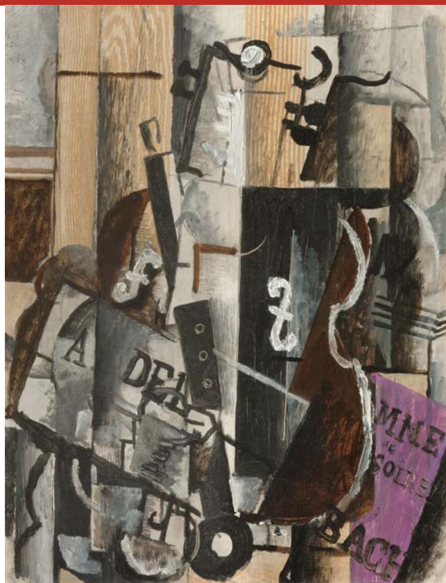
Georges Braque, Zátiší s klarinetem a houslemi, 1913 Národní galerie v Praze

Cena: 50 Kč / 1 osoba starší 1,5 roku (v ceně je zahrnuto vstupné, odborné vedení a výtvarný materiál) / Místo konání: ateliér ve 4. patře Veletržního paláce / Rezervace není nutná. Facebook: Otevřená výtvarná herna.