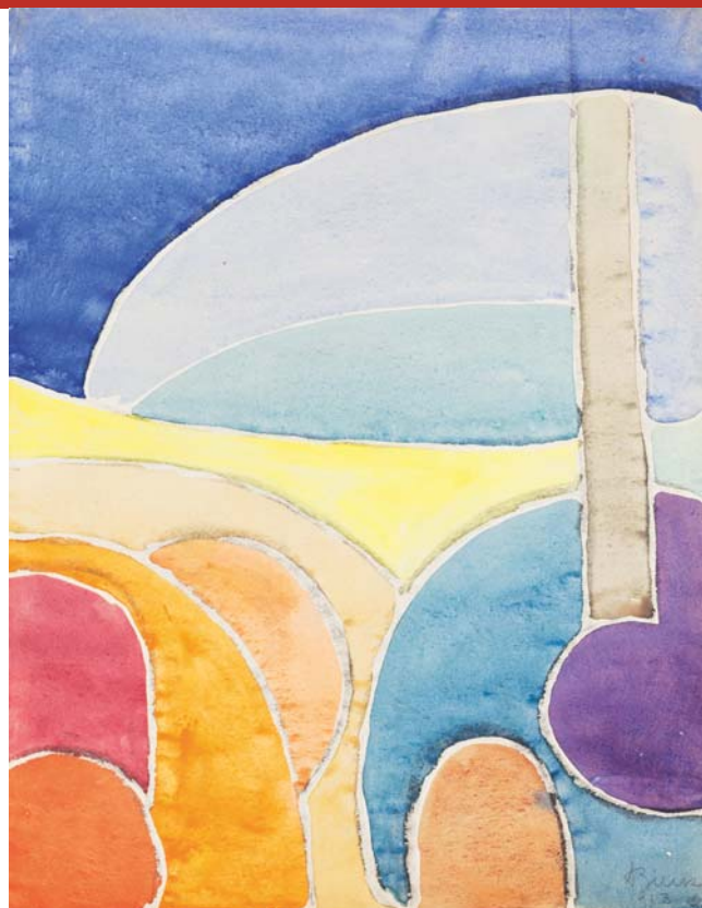
Alois Bilek, Harmonie barev s modrým pozadím, 1913 Národní galerie v Praze

Díla z doby renesance a baroka jsou bohatá na alegorie hudby, zobrazení hudebních nástrojů a symboliku hudebních motivů. Hudební nástroj alegoricky vyjadřoval hudbu samotnou a současně mohl být i metaforou pomíjivosti – značil například neúprosné plynutí času v zátiších vanitas (jako dozní hudební tón, dozní i lidský život). Rozmanitá významovost hudebních nástrojů je patrná zejména v obrazech holandských a flámských malířů. Například loutna nebo viola da gamba svým tvarem připomínajícím ženské tělo byly vnímány jako nástroj stvořený k opěvování lásky. Loutna byla hojně užívána i v zátiších pro svůj oblý