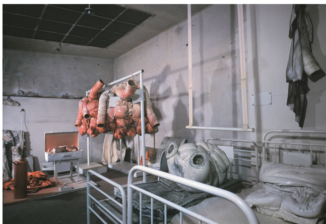
Rehabilitační oddělení Dr. Dr., 1970-1971