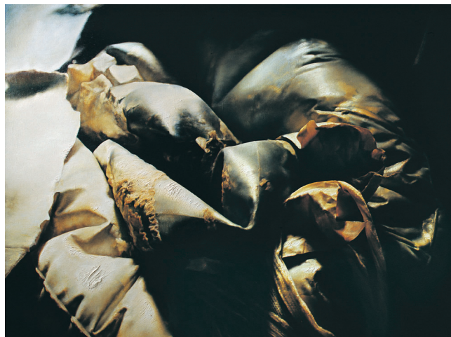
Pokus o duševní únik (spíše nahoru), 1996-1997

maluje monumentální obrazy naplněné existenciálními obsahy, tématy rozkladu a pomíjivosti předmětného světa