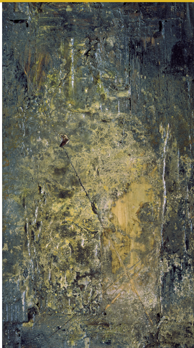
Střední struktura II, 1961

e-mail: vzdelavani@ngprague.cz , www.ngprague.cz