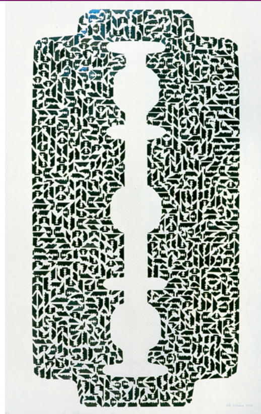
Žiletka I, 1969, asambláž