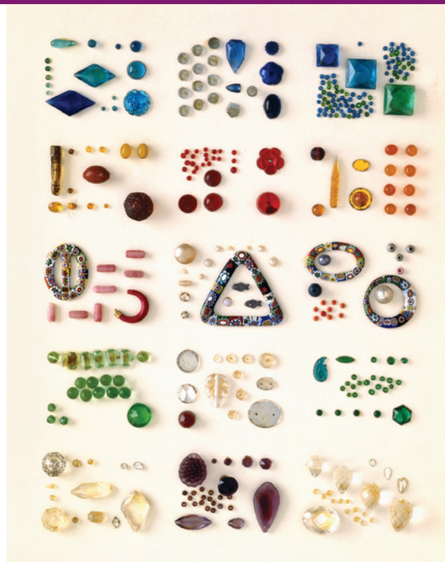
Vzorník pro Kleopatru, 1964, asambláž

Uplatňování subjektivity ve vizuálně obrazném vyjádření Ověřování komunikačních účinků vizuálně obrazných vyjádření