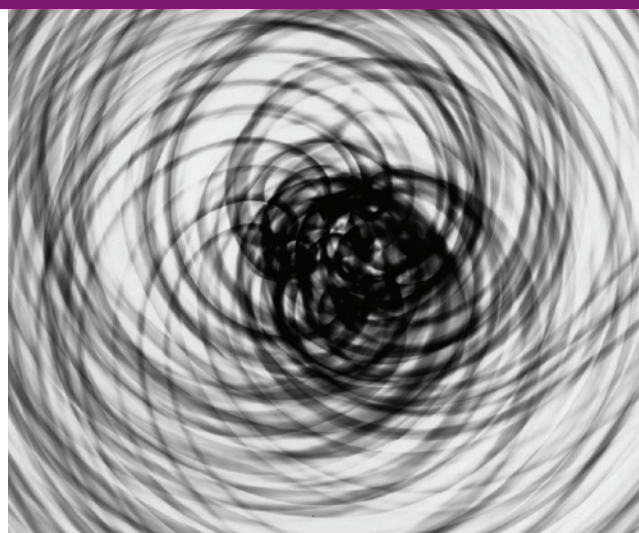
Rentgenogram kruhu, 1962, bromostříbrná fotografie, kresba světlem