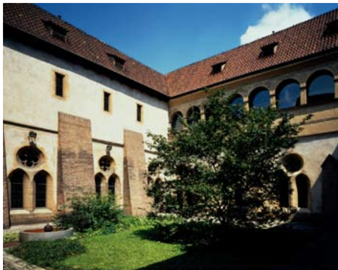
Klášter sv. Anežky České