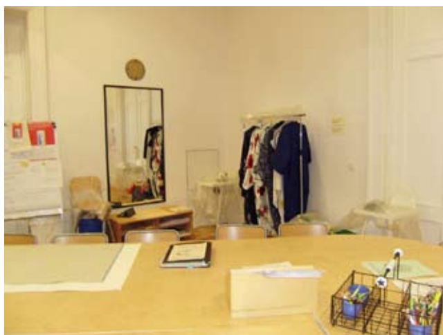
Ateliér s etudou Jak se nosí kimono