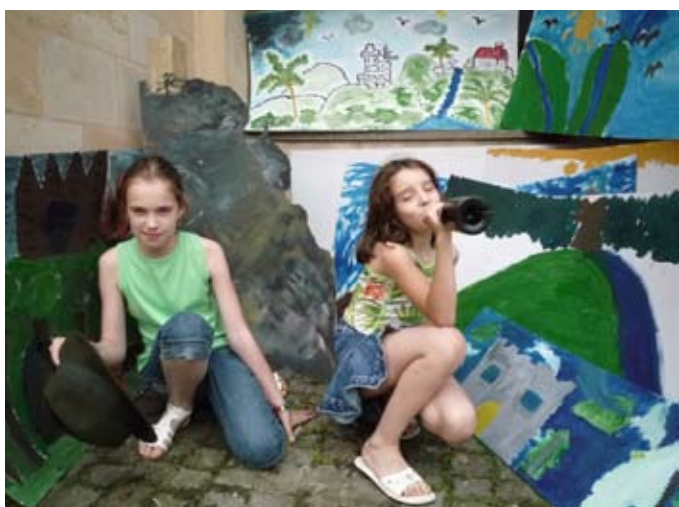
Postavme tajemnou krajinu v rajsém dvoře – muzejní noc v JK