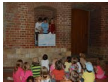
Prběhy dávných časů – letní týdenní dílna – klášter sv. Anežky České