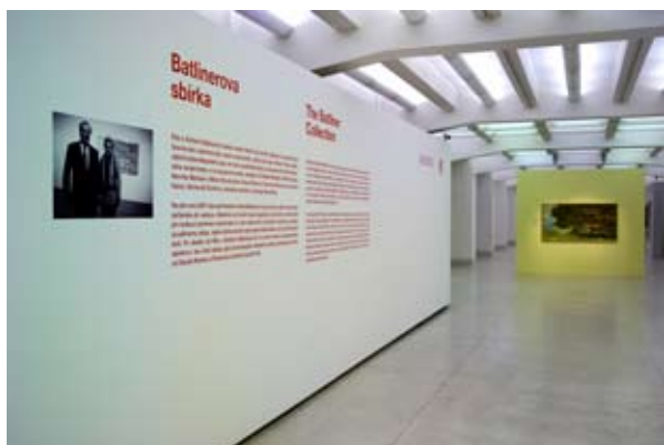
Pohled do výstavy Monet – Warhol . Mistrovská díla z Albertina Museum a Batlinerovy sbírky