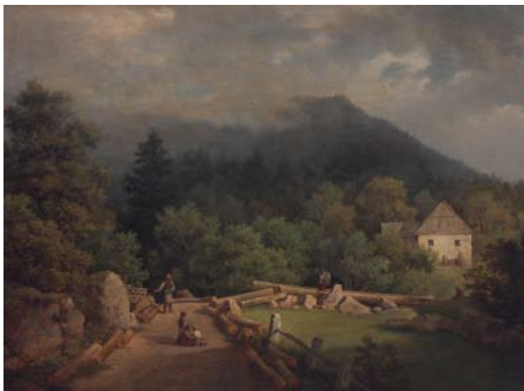
August Bedřich Piepenhagen: Krajina