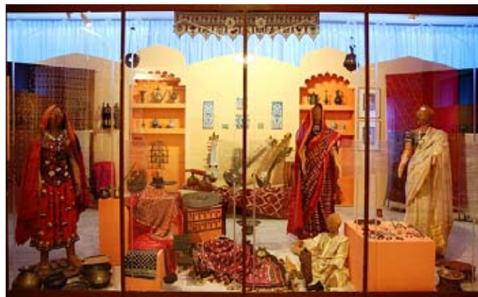
Výstava NG a NM Žena v indickém výtvarné tradici v pavilonu Anthropos v Brně