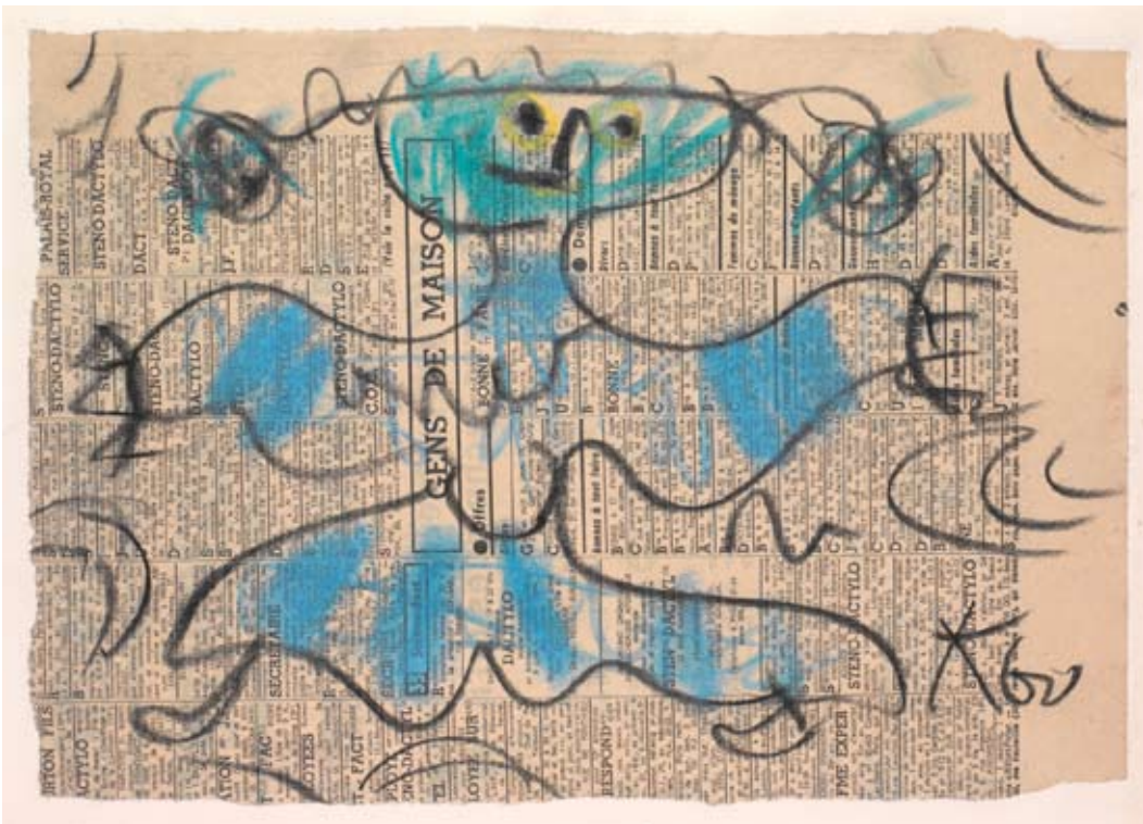
Jan Křížek (1919–1985): Figurativní kompozice