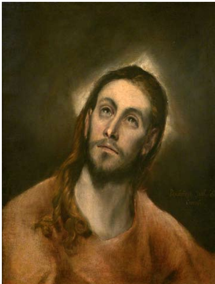
Doménikos Theotokópulos, z. El Greco: Modlíci se Kristus , kolem 1595/1597