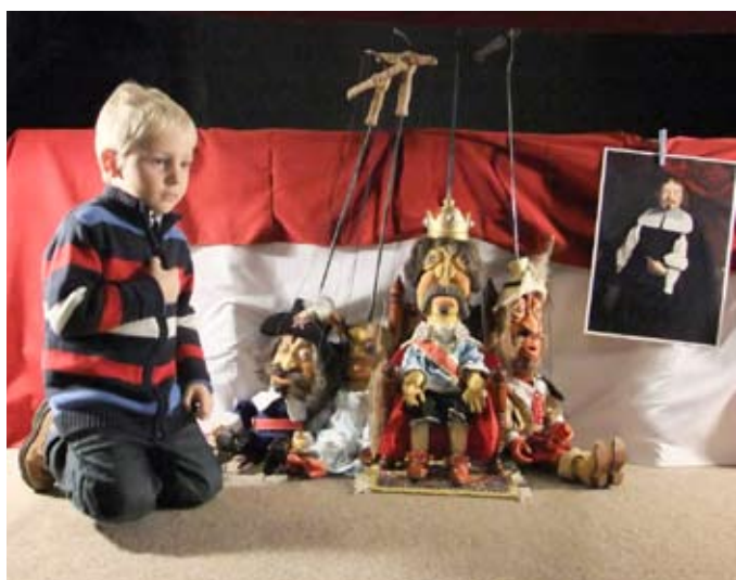
Kterak Karel Škréta ke štěstí přišel – loutkové divadlo – Valdštejnská jízdárna