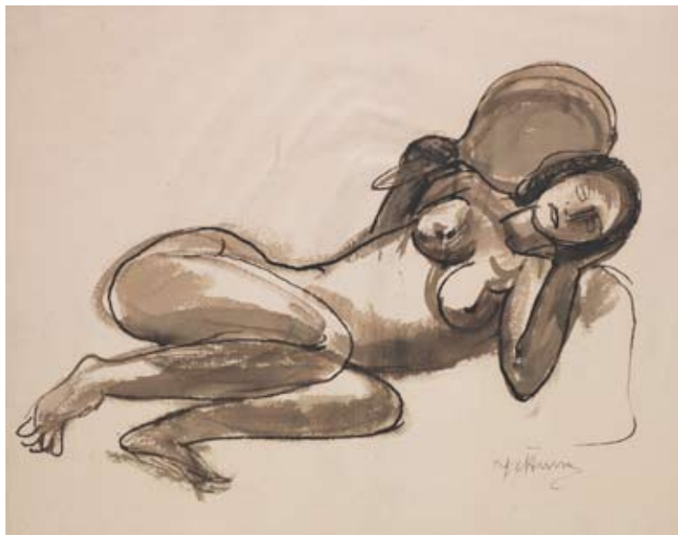
Jan Štursa (1880–1924): Studie k soše Odpočívající tanečnice , 1913