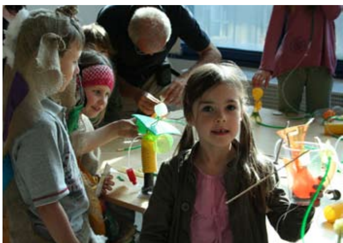
Letní dílna pro děti ve Veletržním paláci Odysseovy cesty