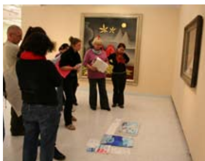
Kurz Cesta k mistrům pro studenty a dospělé