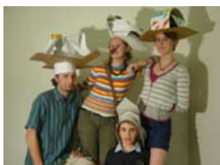
dílna Neobyčejné klobouky