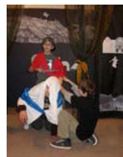
Víkendová dílna – výstava Karel Škréta: Doba a dílo – Valdštejnská jízdárna