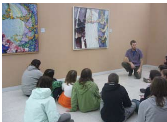
Zrození abstrakce pro SŠ