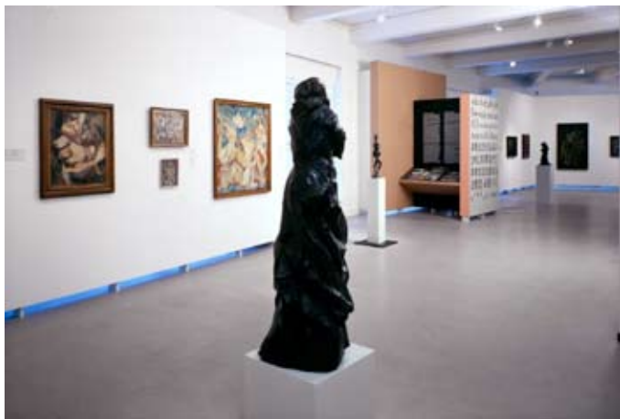
Pohled do expozice Český kubismus 1910–1919