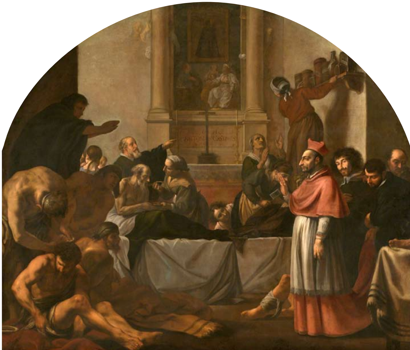
Karel Škréta: Sv. Karel Boromejský navštěvuje nemocné morem v Miláně, 1647