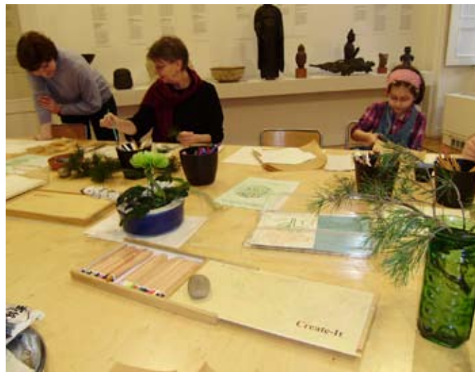
Ateliér Fénix. Pořad Motiv borovice