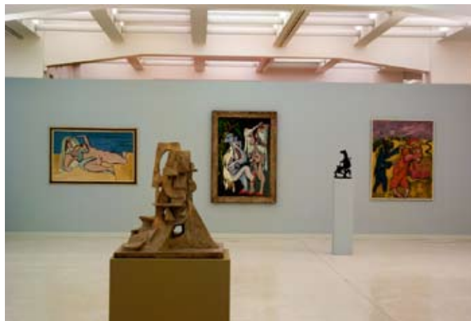
Pohled do expozice České moderní umění II