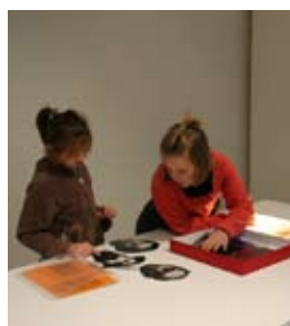
Studijní a interpretační prostor STUDIO I