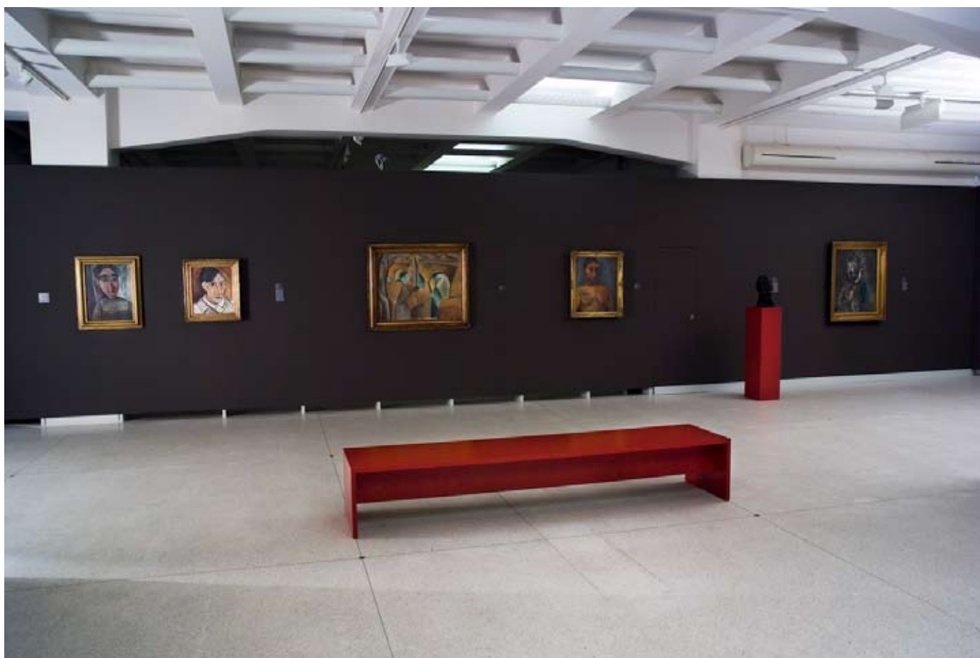
Pohled do expozice Francouzské umění 19. a 20. století