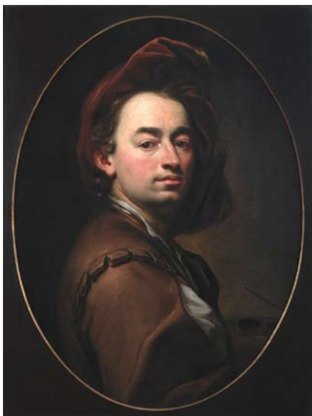
Petr Brandl: Vlastní podobizna z. Lobkovická , kolem 1697