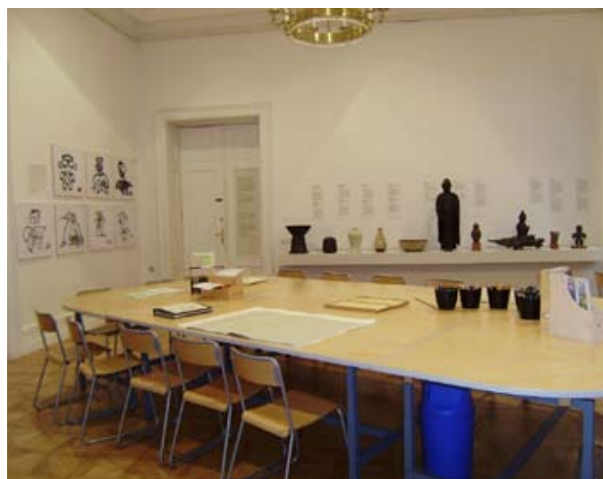
Hmatové expozice Japonská skulptura a korejská keramika