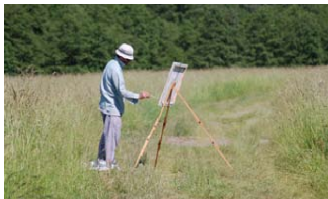
Krajinářský plenér 2010 – Horní Chřibská