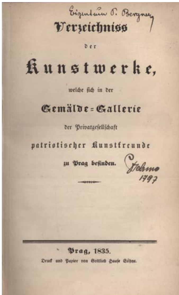
Titulní list zdigitalizovaného sbírkového katalogu Společnosti vlasteneckých přátel umění v Čechách z roku 1835.

umělecké knihovny, realizovaný díky grantovému programu MK ČR VISK 8/B Jednotná informační brána. Cílem projektu je jednoduše a z jednoho zastřešujícího prostředí vyhledávat informace z oboru umění a architektury a vyhledávat uměnovědnou literaturu současně v katalozích všech zúčastněných knihoven projektu (Národní galerie v Praze, Uměleckoprůmyslové museum v Praze, Moravská galerie v Brně, Muzeum umění Olomouc, Galerie výtvarného umění v Ostravě, Vysoká škola uměleckoprůmyslová v Praze, Akademie výtvarného umění v Praze, Národní technické muzeum).