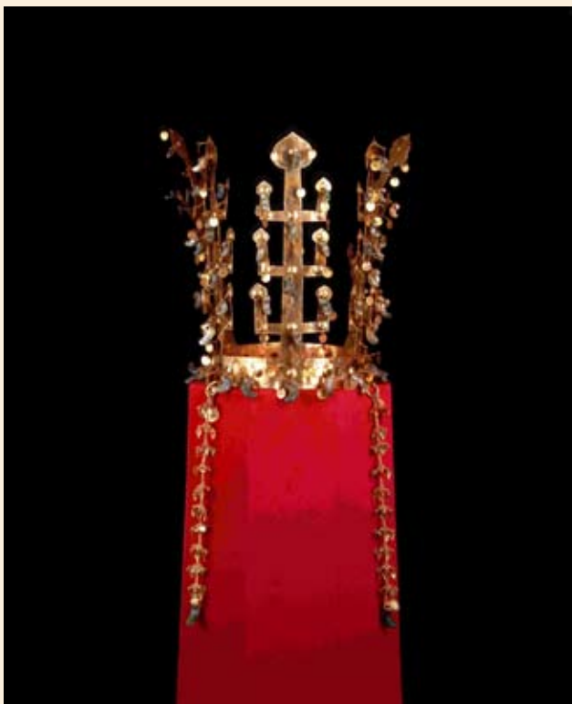
Anonym, Korea: Zlatá koruna z království Silla 27/2010