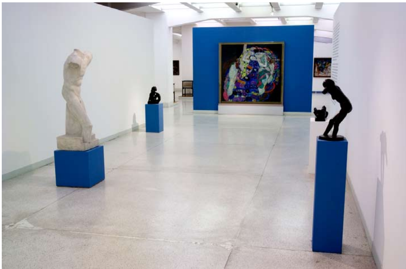
Pohled do expozice Mezinárodní umění 20. a 21. století