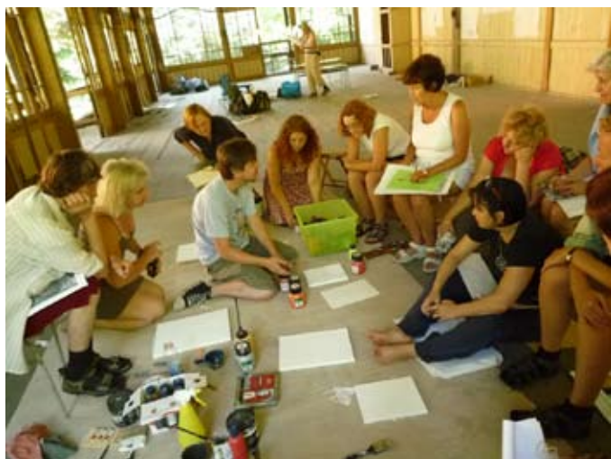
Letní krajinářská dílna 2010