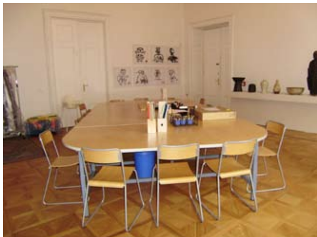
Ateliér s výstavou protlačované kresby nevidomých a hmatovými expozicemi