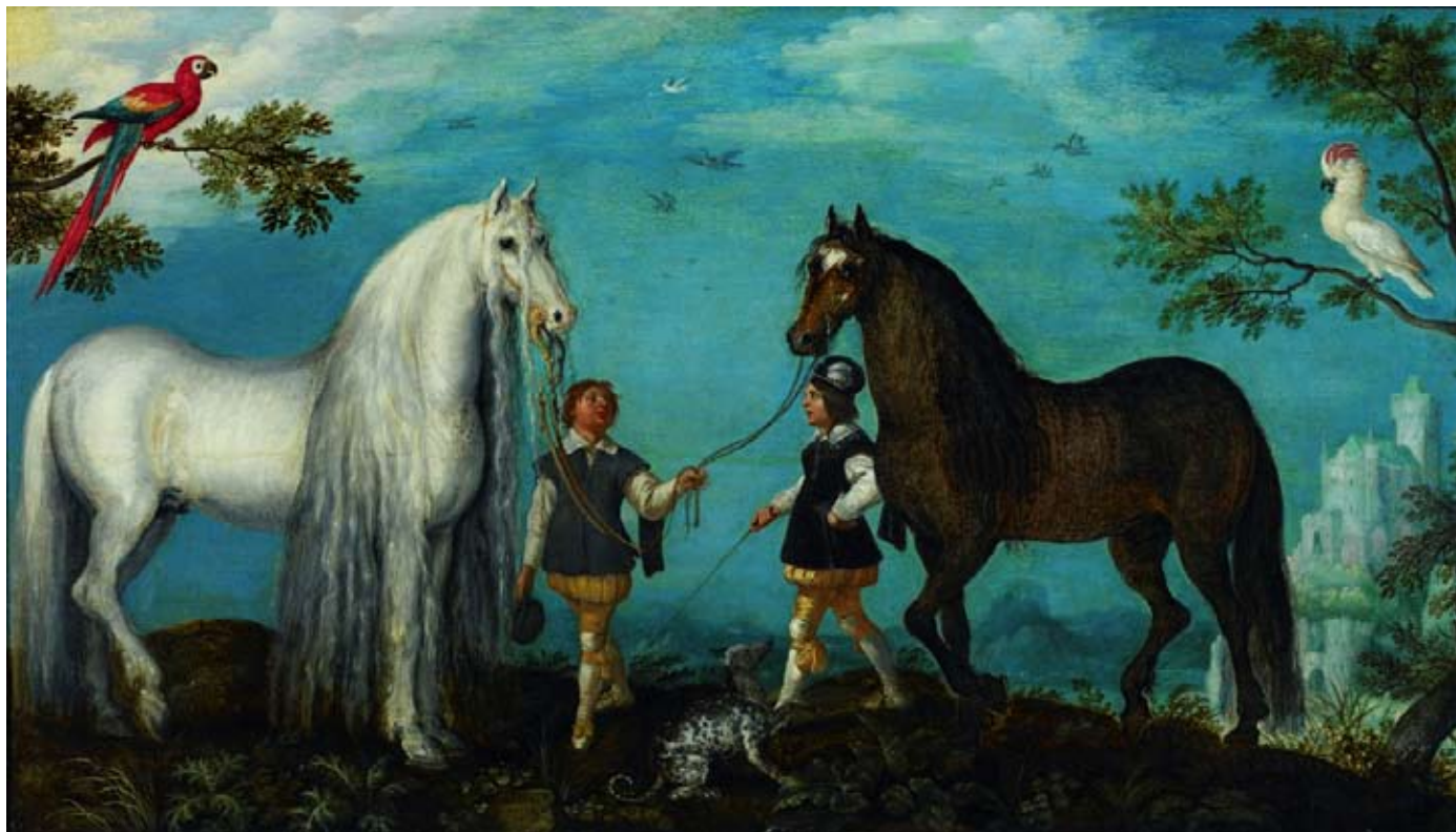
Roelandt Savery: Dva koně s podkoními , 1628, Kotrijk, Broelmuseum