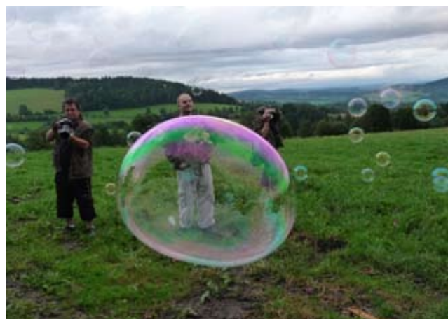
Krajinářský plenér 2010 – Hořejší Těšov