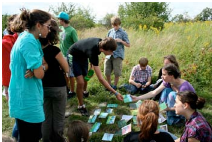
Letní dílna pro mládež 13–16 let Meet the revival