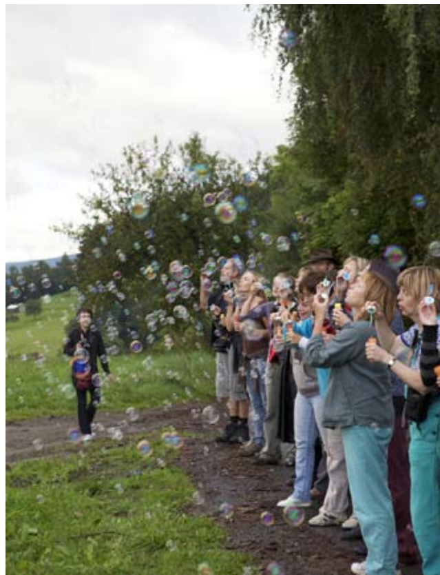
Krajinářský plenér 2010 – Hořejší Těšov