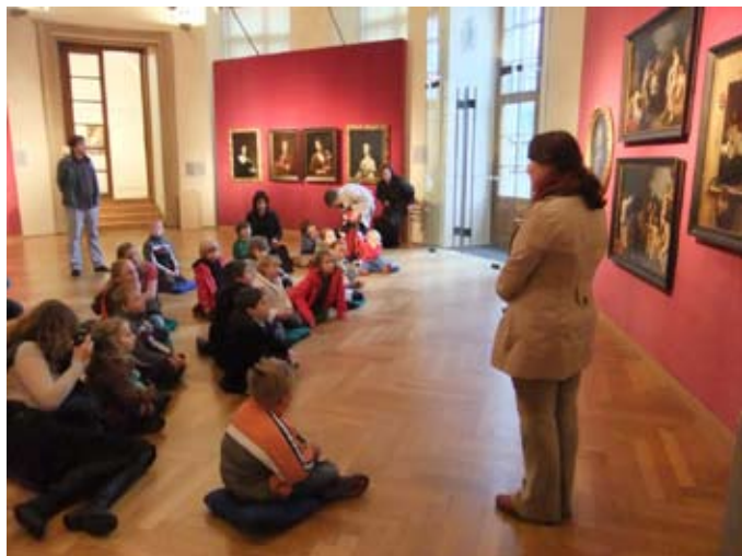
Klam oka – víkendová dílna pro rodiče a děti – Šternberský palác