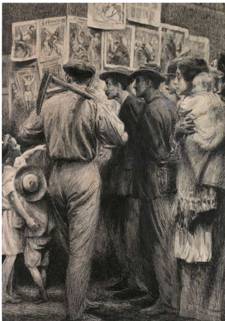
Emil Holárek, Nevědomé učiti , 1895, kresba tuší, papír, 50 × 35 mm