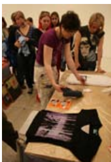
Open Up 4 – sitotisková dílna