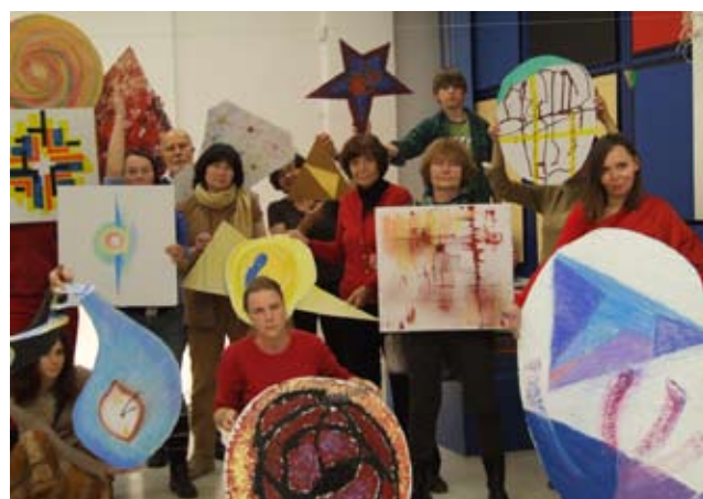
Barevná kompozice v prostoru