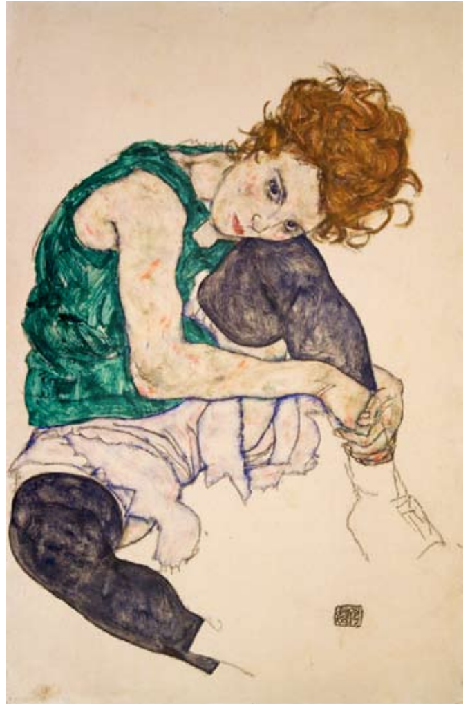
Egon Schiele (1890–1918): Sedící žena s pokrčenými koleny