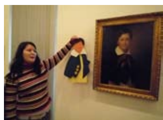
Program pro 2. stupeň ZŠ Druhý život obrazu