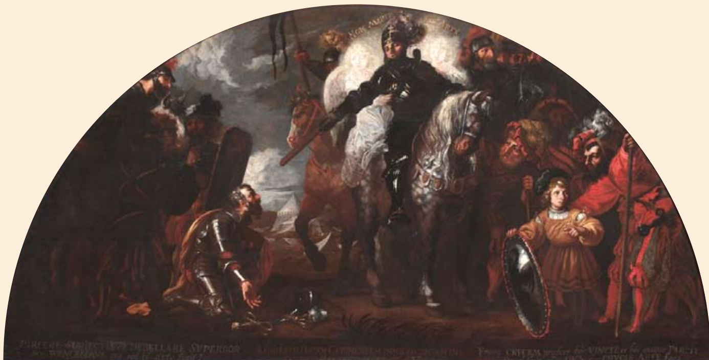
Karel Škréta: Zlický kníže Radslav se koří svatému Václavu , po 1640