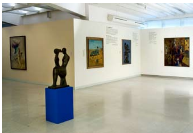
Pohled do expozice České moderní umění III