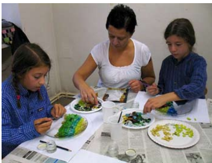
Mozaika – víkendová dílna pro rodiče a děti – kl. sv. Anežky České