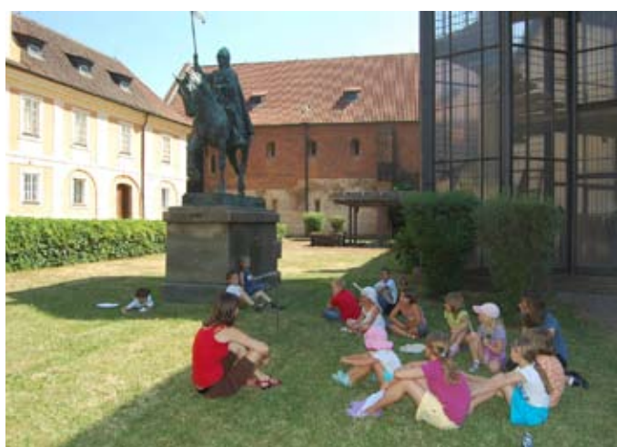
Prběhy dávných časů – letní týdenní dílna – klášter sv. Anežky České