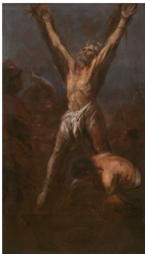
Michael Leopold Willmann: Ukřižování sv. Ondřeje , 1701/1703