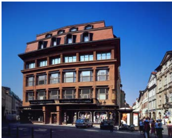
Dům U Černé Matky Boží

V objektu Valdštejnské jízdárny jsou prezentovány výstavy NG na základě smlouvy o přenechání k užívání a) nebytových prostorů Valdštejnské jízdárny, b) movitého majetku, který tvoří vybavení prostorů Valdštejnské jízdárny, jež byla uzavřena mezi Českou republikou – Kanceláří Senátu Parlamentu ČR a NG.