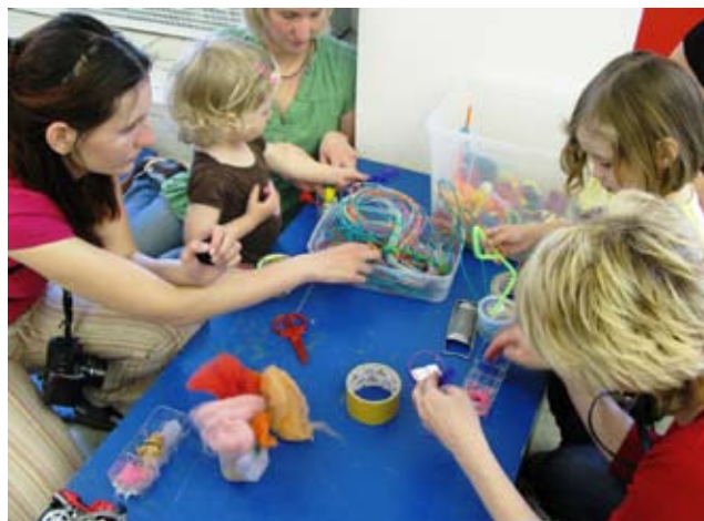
Otevřená výtvarná herna pro děti 1,5–3 roky