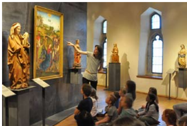
Prběhy dávných časů – letní týdenní dílna – klášter sv. Anežky České