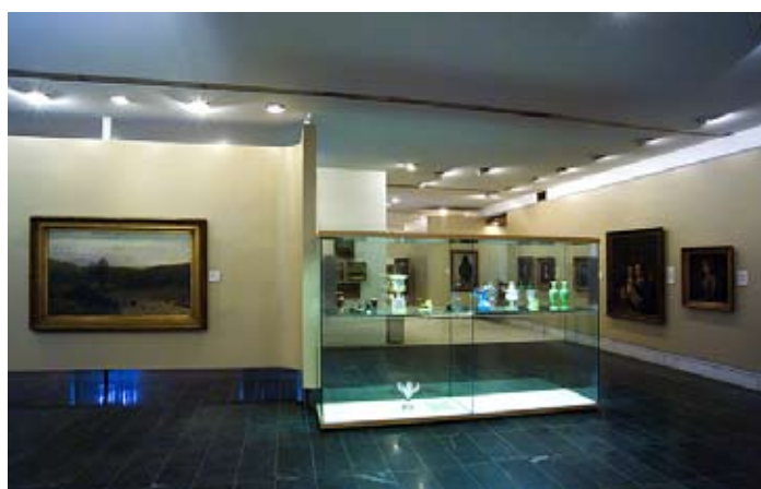
Pohled do expozice Umění 19. století v Čechách (1790–1910)