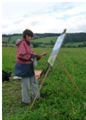
Krajinářský plenér 2010 – Hořejší Těšov