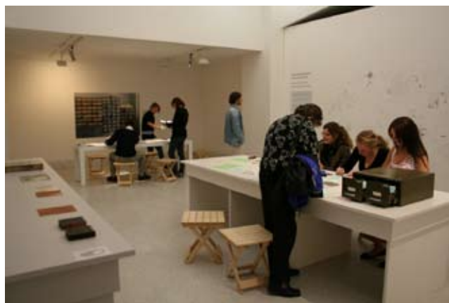
Studijní a interpretační prostor STUDIO I