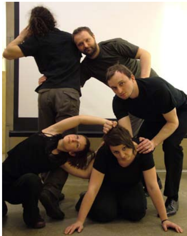
Kromobyčejné výjevy z krajiny 19. století