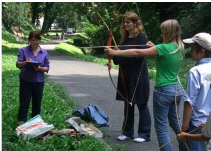
Heráklovy hrdinské činy – letní týdenní dílna – Schwarzenberský palác