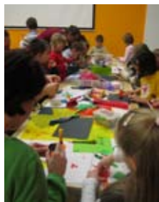
Otevřené ateliéry pro děti a rodiče – Čínské shadows