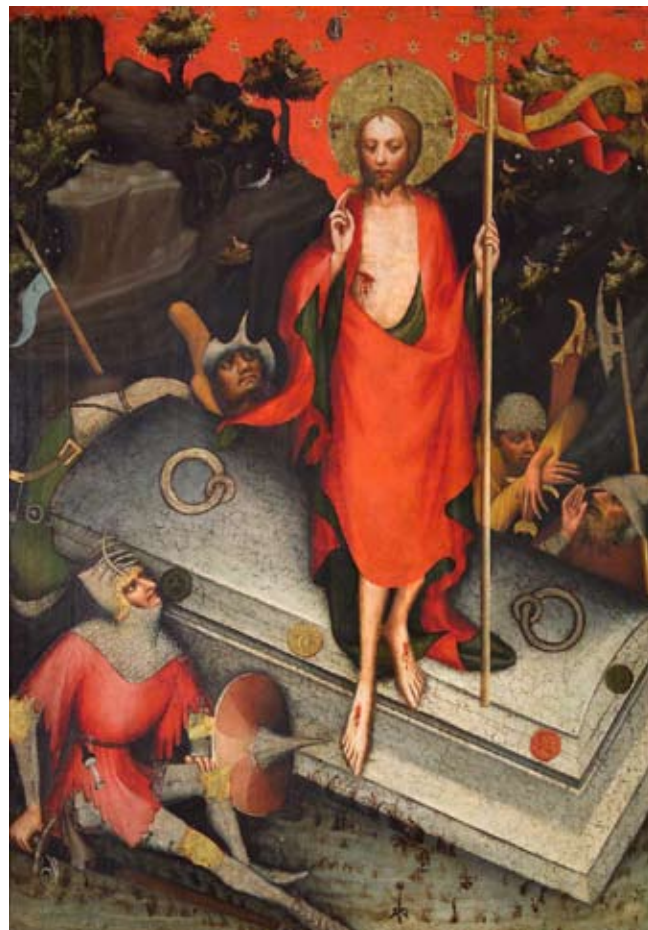
Mistr Třeboňského oltáře: Oltář třeboňský, Zmrtvýchvstání Krista , po 1380