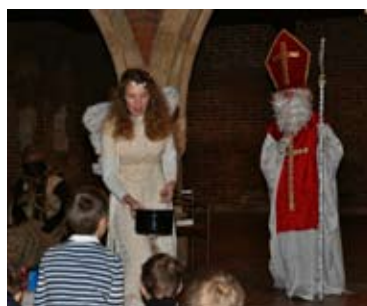
Mikulášská besídka – víkendová dílna pro rodiče a děti – klášter sv. Anežky České