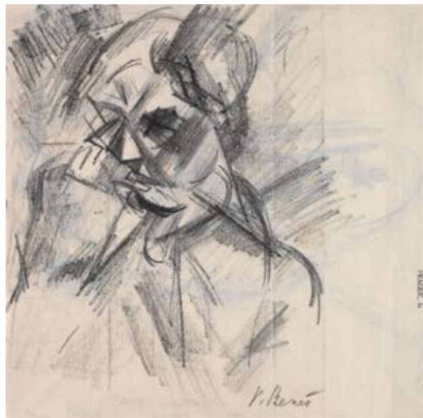
Vincenc Beneš: Hlava , kresba černou křídou, dopisní papír z Hotelu Arcivévoda Štěpán, lícová strana, 1912–1913