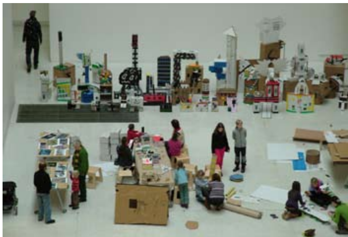
Urban Fairy Tale – městská pohádka I