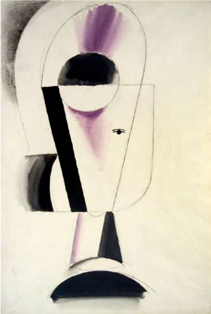
Josef Čapek (1887–1945): Studie hlavy , 1914