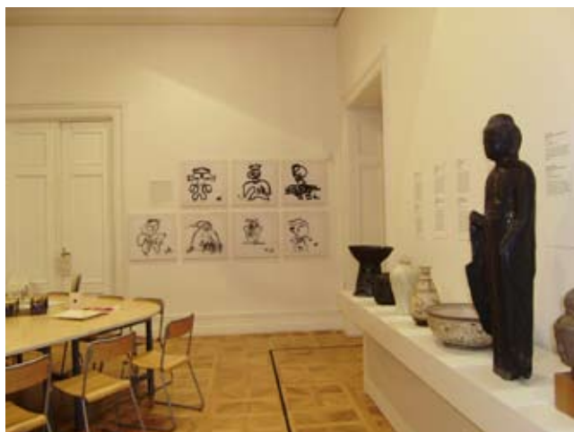
Prezentace Síla a moc dogú