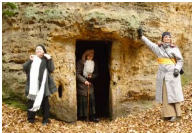
Dramatická dílna Daleká cesta má, marné volání