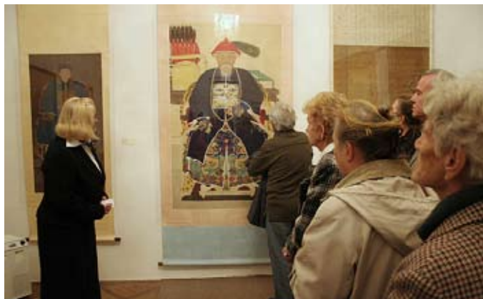
Z vernisáže v Liberci