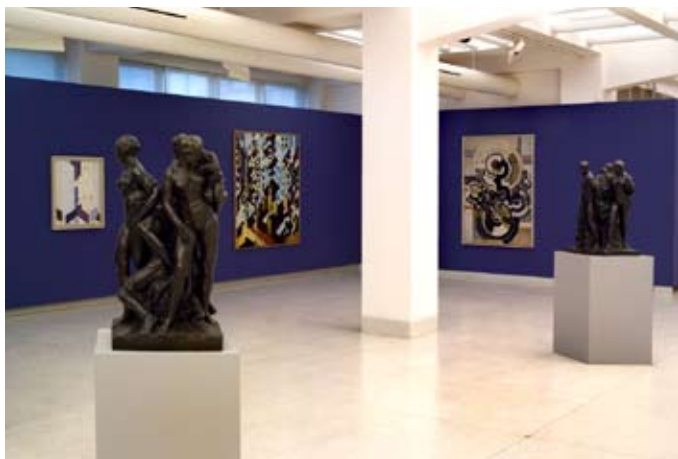
Pohled do expozice České moderní umění I