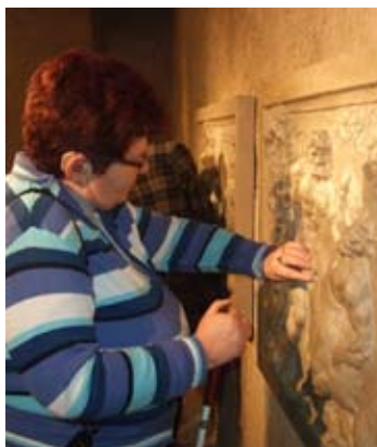
Doteky baroka – program pro hluchoslepé – Schwarzenberský palác