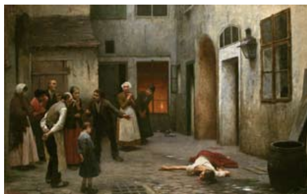
Jakub Schikaneder: Vražda v domě , olej na plátně