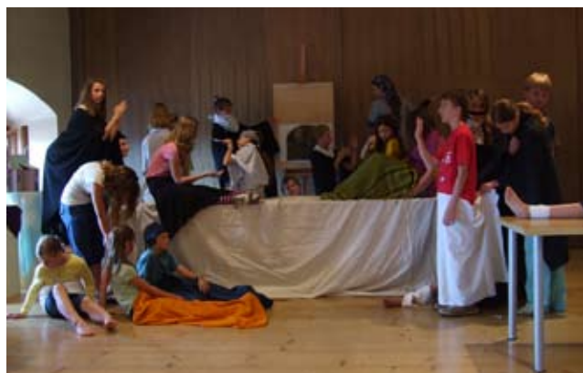
Po stopách starých mistrů – letní týdenní dílna – Schwarzenberský palác